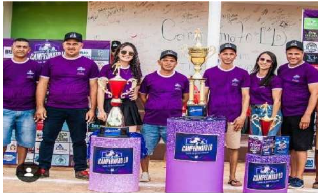
Campeonato de Fut 7 – Lagoa de Dentro – Comissão Organizadora