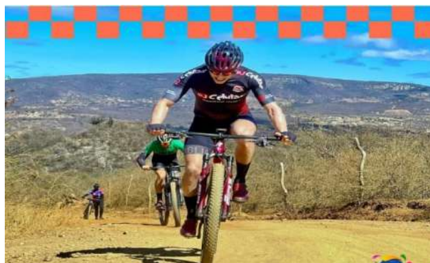
Bicicletada e Caminhada da Amizade