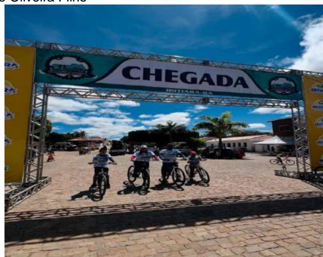
Bicicletada e Caminhada da Amizade