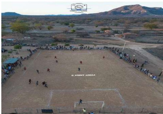
Copinha Surubim de Fut 7