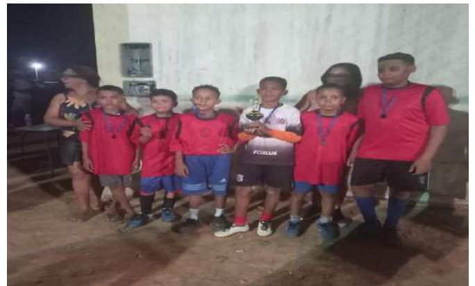
Festival de futsal da Escola do Pau D'Arco