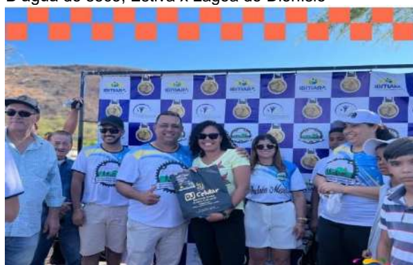
Bicicletada e Caminhada da Amizade