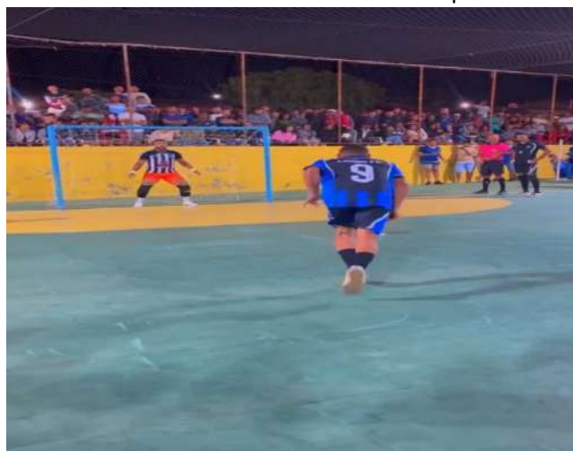
Semifinal do 2º campeonato de futsal de Olhos D'água do seco, Estiva x Lagoa do Dionísio