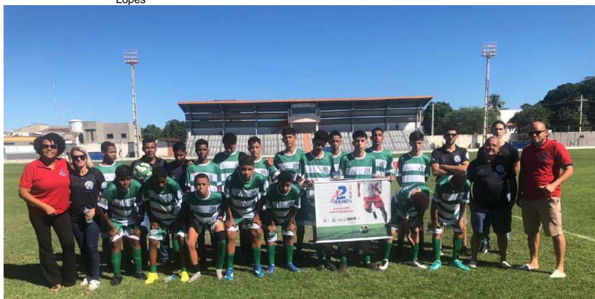
Seleção de Ibitiara sub 15 – Copa 02 de julho – Estádio de Ibotirama