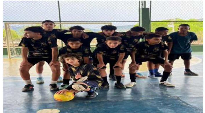
Festival de Futsal da Escola Manoel dos Santos – Caldeirão